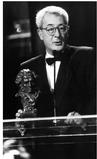
En Jaume rebent el Goya

Això de tenir un premi Goya és molt relatiu, depèn en bona part de la qualitat dels altres nominats.