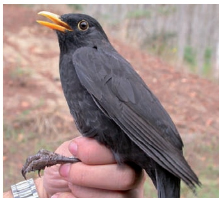
Una merla mascle ( Turdus merula ) durant una sessió d'anellament

que aquest any només un 42% dels exemplars anellats eren joves, en comparació amb un 55'7% de l'any passat, és a dir, 13'7 punts per sota.