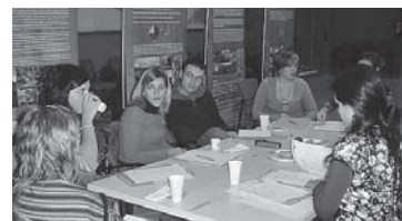
Una de les taules de treball de la 1a Jornada de l'Estany

Malgrat l'èxit del primer procés participatiu, encara queden moltes coses per fer respecte a la participació, queden molts col·lectius per implicar-hi i moltes veus que encara s'han de fer escoltar. És per aquest motiu que aquest setembre reactivem el procés participatiu, primer a través del Sobre Terreny Jove, amb una competició per equips en què els participants hauran de demostrar els seus coneixements i habilitats en proves diverses i sorprenents, molt lligades a l'Estany. I en segon lloc, amb la celebració de la 2a Jornada de l'Estany de Sils, aquest cop centrada en les temàtiques que des del procés participatiu anterior es van considerar prioritàries: l'educació ambiental en espais naturals i la recerca i els estudis a l'Estany de Sils.