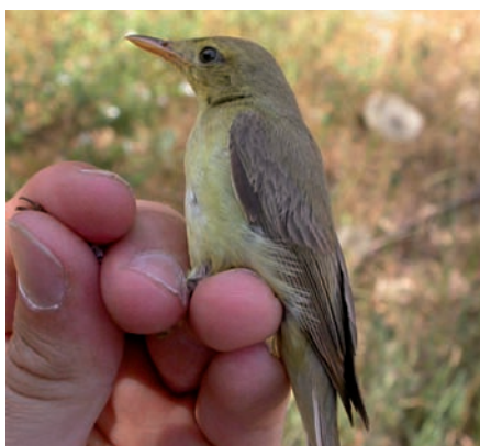
Bosqueta vulgar ( Hippolais polyglotta ) atrapada en una de les xarxes preparades per a l'anellament

Com hem dit anteriorment, una de les estacions Sylvia de les que s'han pogut extreure les dades és la que es troba a l'Estany de Sils. Malauradament és una estació molt nova, només té tres anys, i no es disposa de suficients dades per comparar amb anys anteriors, però si ens mirem les dades d'aquest any amb comparació amb l'any anterior, i salvant les distàncies, podem dir