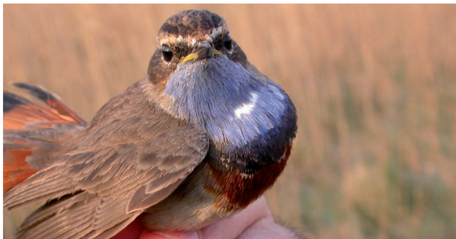
Cotxa blava ( Luscinia svecica ) en una sessió d'anellament

Enguany, i segons un estudi realitzat per l'ICO Institut català d'ornitologia, l'èxit reproductor dels ocells, és a dir, els polls que han pogut tirar endavant, ha estat el més baix dels últims 10 anys. Aquest estudi s'ha fet gràcies a les dades recollides per les més de 60 estacions Sylvia d'anellament que hi ha a Catalunya, entre elles la de l'Estany de Sils. Algunes de les conclusions que s'han pogut extreure és que en un 73% de les espècies, el nombre de joves ha estat el més baix recollit fins ara: per exemple, en el cas del Tallarol de Casquet ( Sylvia atricapilla ), s'ha estimat que aquest any han hagut uns 400.000 joves menys de mitjana. Segons sembla els principals motius d'aquesta davallada han estat la sequera de principis de primavera, amb la manca d'aliments que això suposa, i les abundants pluges d'estiu, que han malmetès els nius de moltes espècies.