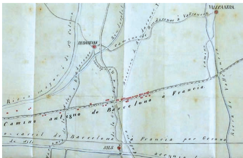
Part del croquis inclòs en l'expedient d'al·legacions al projecte de 1867, obra del mestre de cases Josep Gallart. S'hi veu el carrer de Mallorca, única aglomeració urbana de Sils i de Vallcanera.

la llei ho exigia per donar suport a les posicions d'uns i altres (així com els interessos comuns que poguessin tenir els diversos pobles agregats, o les enemistats o simpaties, que en algun cas s'expressen).