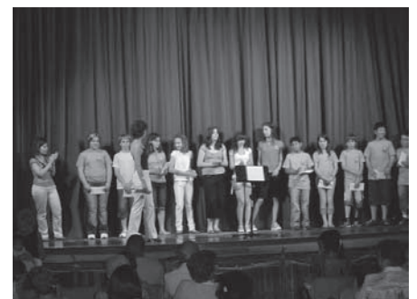
Els nois i noies que van recollir els diplomes de grau