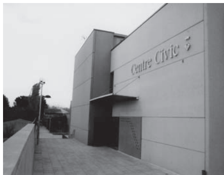
El Centre Cívic de Sils

L'Espai Jove ha continuat la seva activitat com ho fa habitualment durant tot l'any: dilluns, dimecres i divendres de 16:00 a 20:00 h, però a diferència d'altres estius, aquest any s'ha desenvolupat en el Centre Cívic en comptes de la Sala Cultural La Laguna.