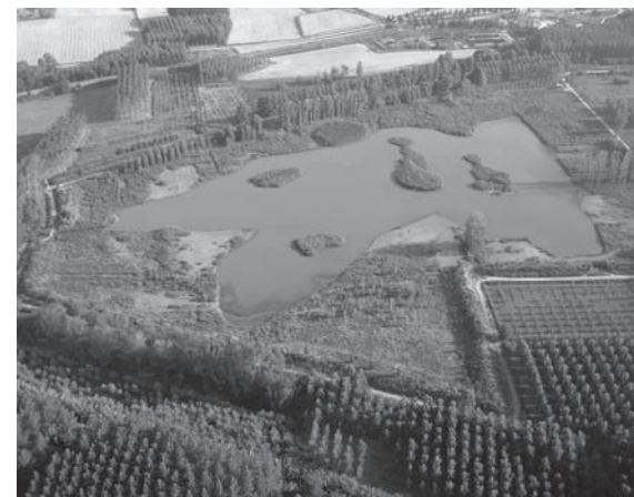
Vista aèria de la llacuna permanent de l'Estany de Sils, des d'un globus aerostàtic