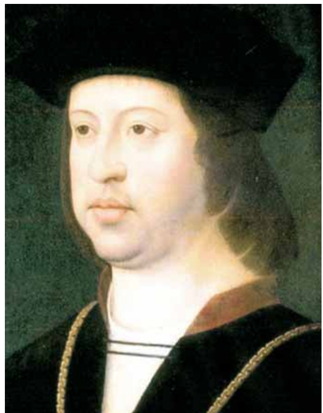
Sota el regnat de Ferran II el Catòlic, que va governar del 1479 fins al 1516, va tenir lloc el difícil desenllaç del conflicte remença.