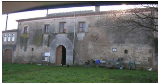
Façana Nord (principal)