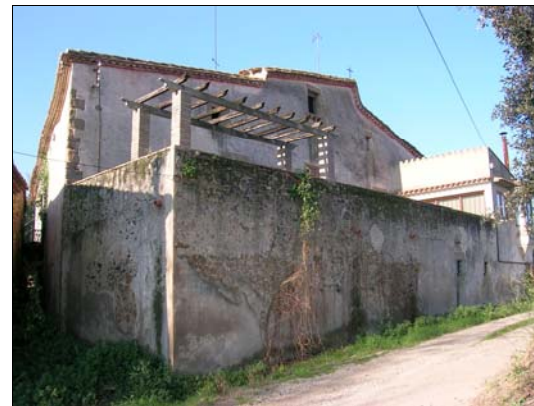
Façana Sud i Est