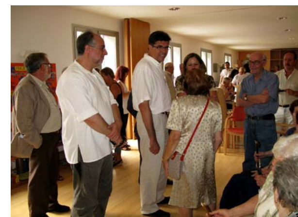
Inauguració de la Plataforma de Serveis per la Consellera Carme Capdevila el passat 21 de juliol de 2010