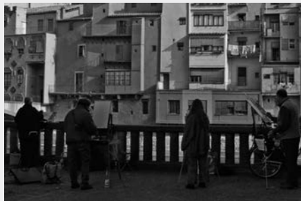
Fotografia d'alguns socis pintant el Dia Mundial de l'Aquarel·la

L'Agrupació d'Aquarel·listes de Girona es va fundar l'any 1992 amb la finalitat de fomentar i divulgar l'aquarel·la. Actualment som un centenar de socis i mantenim bones relacions amb d'altres Agrupacions aquarel·listiques tant de l'Estat Espanyol com de l'estranger i d'altres entitats culturals, un exemple en seria l'exposició sobre Walter Benjamin que vam fer al Museu de l'Exili l'any 2009.