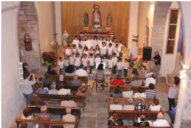
Diada de la gent gran d'Espionellà 2009

En acabar l'any és bo mirar enrere per veure la feina feta. Cal fer memòria del que la gent gran del nostre municipi hem fet i hem gaudit.