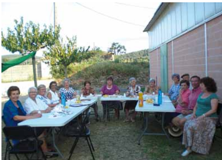
Berenar del casal d'Espionellà estiu 2009

El fet que hi hagi una junta no vol dir que ningú tingui cap privilegi, tot el contrari, necessitem l'opinió i col·laboració de tots per fer del nostre Casal un lloc d'esbarjo i germanor i passar estones ben agradables.