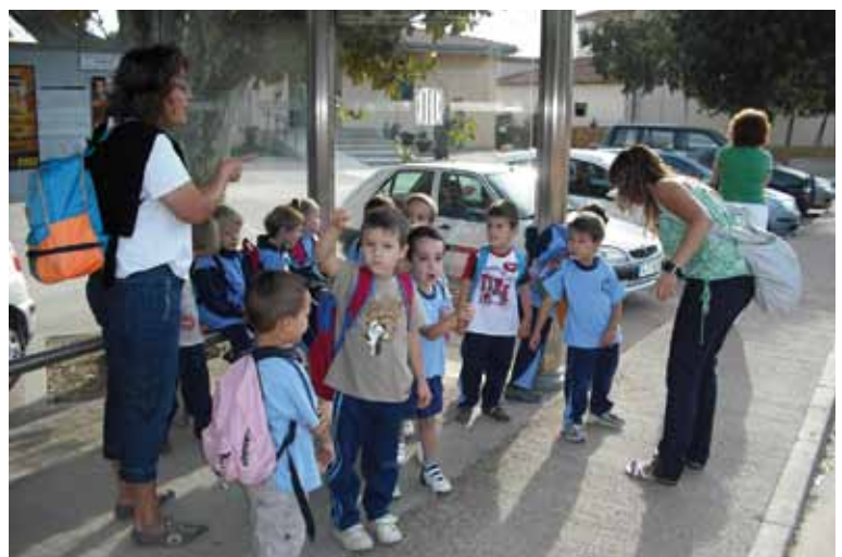
Els nens i nenes de P-4 a la parada de la Teisa, esperen l'autobús per anar a Banyoles.