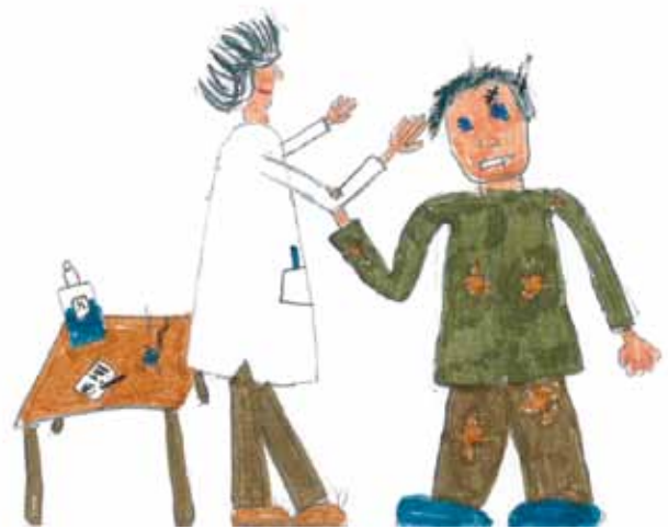
Després de veure l'obra de teatre en anglès Frankenstein, així és com els alumnes de Cicle Superior veuen el protagonista.

I per acabar, els nens i nenes de Cicle Superior van anar al Centre Cívic de Porqueres a veure l'obra de teatre en anglès Frankenstein , juntament amb altres escoles.