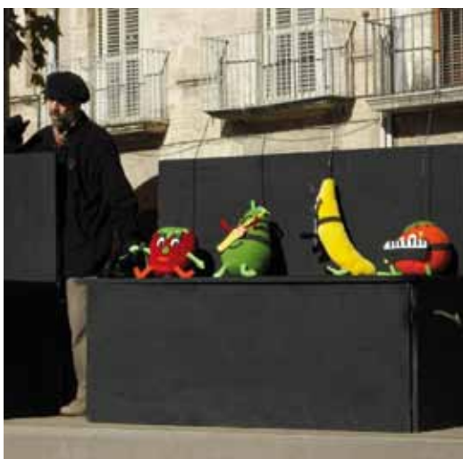
Els alumnes de P-5 van participar en l'activitat Menja Fruita a Banyoles.