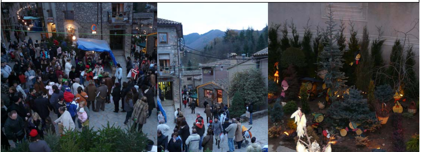
Fira de l'Avet