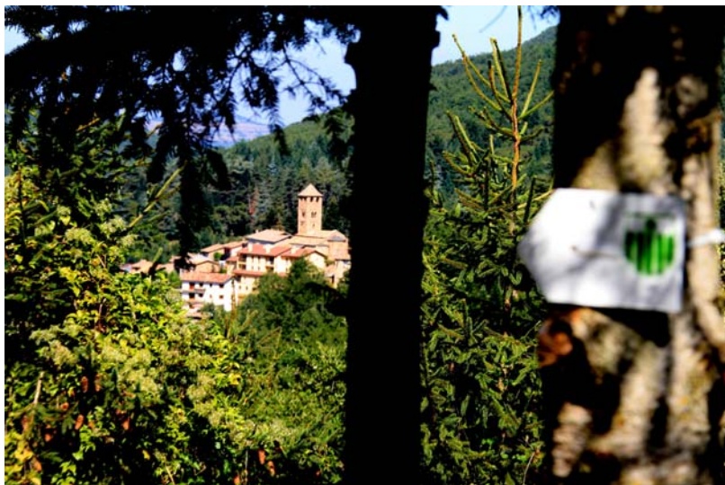
Ruta dels Miradors

Els senders han estat sens dubte una bona experiència i poden ser també una bona eina per comunicar-se millor amb els pobles de l'entorn. Ara, des de la mancomunitat Guillerries i l'Agenda 21 volem promocionar rutes que ajudin a vertebrar la nostra subcomarca. A veure si aviat podem senyalitzar un sender entre Sant Hilari i Espinelves!