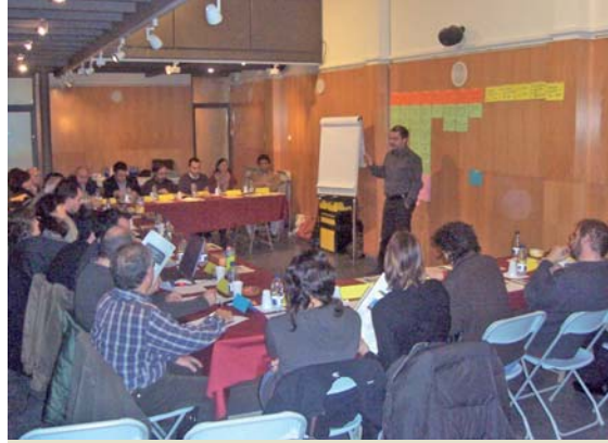
Jornada a Anglès

El Departament de Medi Ambient juntament amb l'ACA han organitzat el Procés participatiu del Baix Ter per a la redacció del Pla de gestió de conca i la creació del futur Consell de Conca del Ter. Com a representants d'un poble que volem viure de cara al riu i que volem que porti aigua suficient i de qualitat, hem assistit a les sessions de treball per fer-hi les nostres aportacions. El procés ha consistit en diverses jornades: