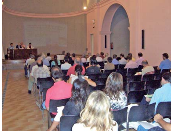
Jornada a Salt

primer, en unes sessions de treball per a sectors relacionats amb el riu ( administració, entitats, industrials i empresaris, agroramaders i forestals ). A partir de les aportacions de cada sector després s'han fet unes altres sessions de treball per temes que han estat: la contaminació urbana, industrial i sanejament, contaminació agrària i ramadera, qualitat hidromorfològica i biològica i cabals de manteniment, estalvi, consum i abastaments . Finalment, s'ha fet una sessió plenària on cada taula va presentar les seves propostes. Queda pendent encara la sessió de retorn amb els tècnics de l'ACA. El resum de tot el procés i la documentació la podeu consultar a l'adreça: www.acaparticipacio.cat/concadelter